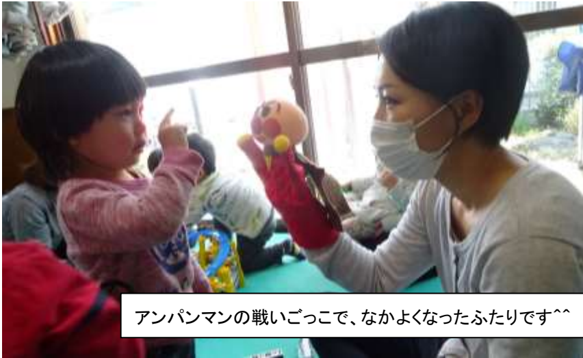
アンパンマンの戦いごっこで、なかよくなったふたりです^^

2017年4月発行 発行: NPO法人彩の子ネットワーク 上尾市つどいの広場「あそぼうよ」 住所: 上尾市二ツ宮1156-3 電話: 048-778-5102 (相談専用) 048-778-5103 http://www.sainoko.net/asobouyo/asobouyo_top.html E-mail: office@sainoko.net