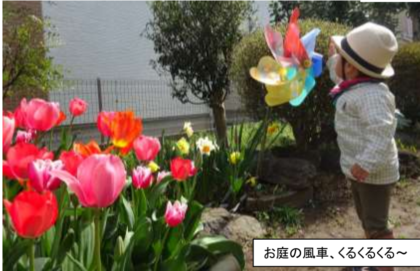
お庭の風車、くるくるくる～

2017年5月発行 発行: NPO法人彩の子ネットワーク 上尾市つどいの広場「あそぼうよ」 住所: 上尾市二ツ宮1156-3 電話: 048-778-5102 (相談専用) 048-778-5103 http://www.sainoko.net/asobouyo/asobouyo_top.html E-mail: office@sainoko.net