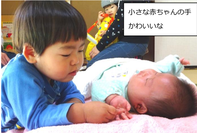
小さな赤ちゃんの手 かわいいな

2017年12月発行 発行: NPO法人彩の子ネットワーク 上尾市つどいの広場「あそぼうよ」 住所: 上尾市ニツ宮1156-3 電話: 048-778-5102 (相談専用) 048-778-5103 http://www.sainoko.net/asobouyo/asobouyo_top.html E-mail: office@sainoko.net