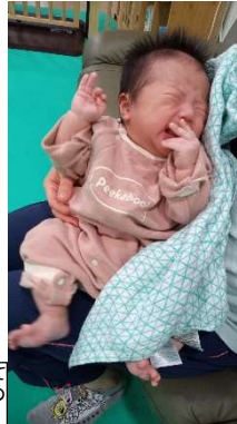
1か月のKくん、どうして泣いているのかな？そのワケは、裏面へ！

兀ふたご座オリオン座サロン兀(ふたご・みつご・きょうだいの子育て♪みんな集まれ♪)