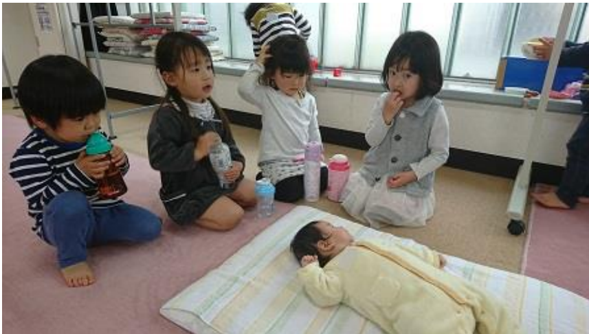
3歳のおにいちゃん、おねえちゃん達の 赤ちゃん見学ツアー♪ お茶を片手に、「赤ちゃんかわいいね〜」だって♪

11:45~12:00 と、14:45~15:00 は、手遊びと絵本の読み語りの「ハッピータイム」を楽しんでいます。