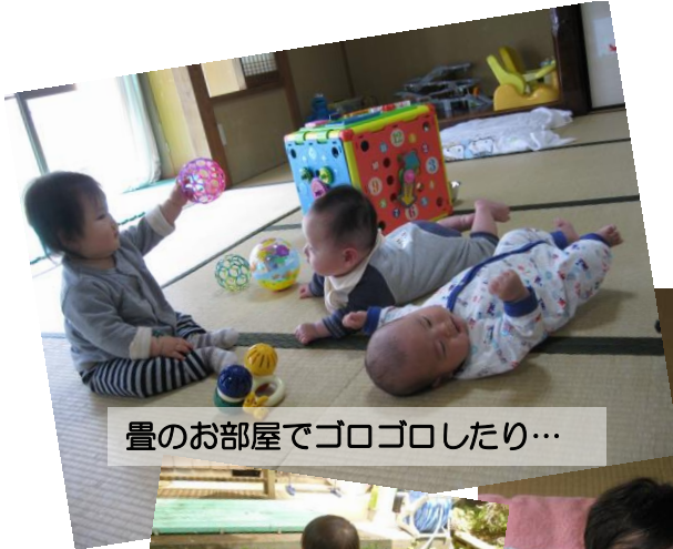
畳のお部屋でゴロゴロしたり…

←携帯で「あそぼうよ」の月間予定が確認できます。 http://www.sainoko.net/mobile/asobouyo.html