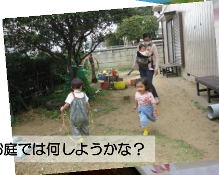
お庭では何しようかな？

※駐車場は、あそぼうよ西側の駐車場か、発達支援相談センターの第2駐車場がご利用できます。