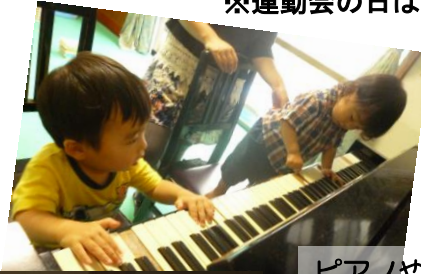
ピアノやおままごとも楽しい♪