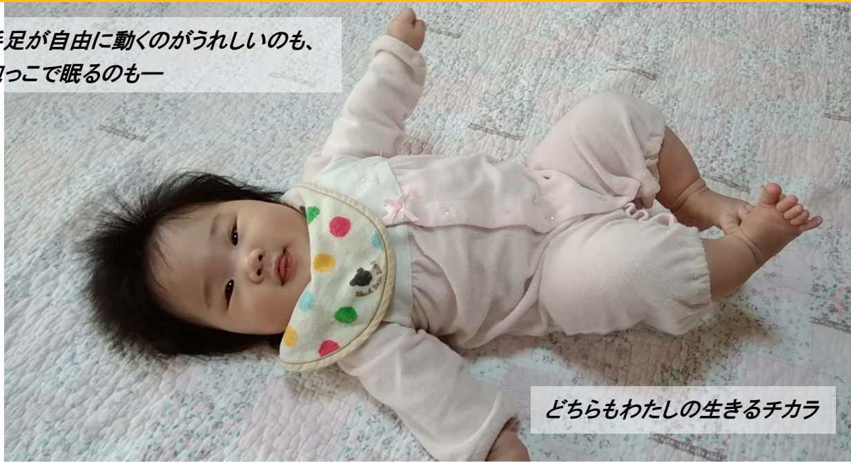
どちらもわたしの生きるチカラ

子どもには、自分で自分のことをできるようになってほしい—そう願う私たち。 だけど、生まれてすぐ何もかも一人でできるわけじゃない。人の手がありながら育っていく。その中で、どうやって子どもは自立していくのだろうか？