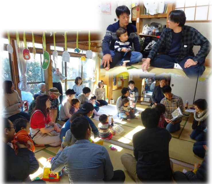
第1回「パパがひらく子育てサロン」の様子