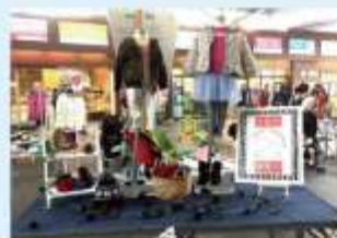
子ども服コーディネート