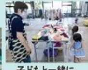
子どもと一緒に洋服を選んだり