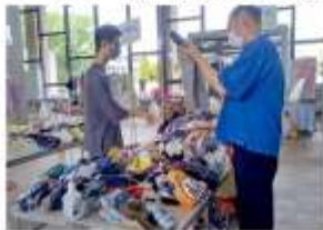
世代が違う人との出会いがうれしい