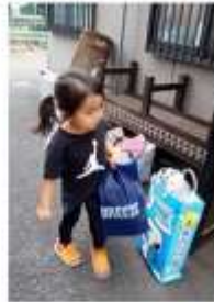
4歳 わたしも一緒に手伝い