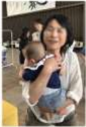
赤ちゃんとの出会いがうれしい