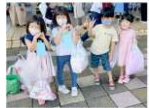
自分で選んでうれしいね♪