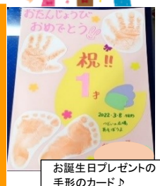
お誕生日プレゼントの手形のカード♪

各時間(10時～12時 / 13時20分～15時)12組程度のご利用です。 来館の際の注意点や予約方法は、本町のあそぼうよと同様です。 場所：尾山台みんなの広場(上尾市瓦葺2716 尾山台郵便局隣) 毎週月曜日 10時～15時