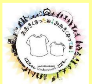
上尾市協働のまちづくり事業 (2022・2023)